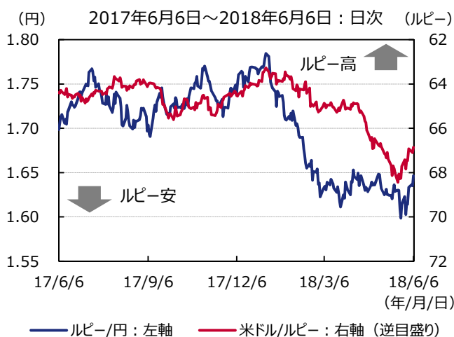
図表2 インドルピーの推移

期間：2013年1月1日～2018年6月6日（政策金利、日次） 2013年1月～2018年4月（消費者物価、月次） 出所：ブルームバーグ、インド財務省のデータを基にアセットマネジメントOneが作成 （注）政策金利はレポ金利