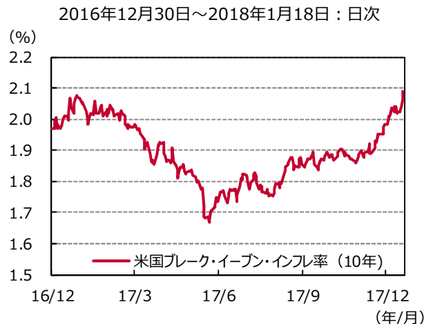
図表2 米国期待インフレ率の推移

（注）ブレイク・イーブン・インフレ率は、固定利付き国債の利回りから同じ残存年限の物価連動国債の利回りを差し引いたもので、期待インフレ率を示すとされる。