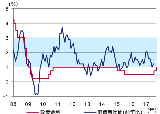
図表1 政策金利と消費者物価